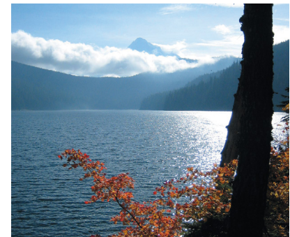
Bull Run ha sido la fuente de abastecimiento de agua del distrito por más de un siglo

Para más información sobre el proceso del presupuesto y copias de los documentos de presupuestos anteriores, revise nuestro sitio web en este enlace: https://www.wswd.org/annual-budget